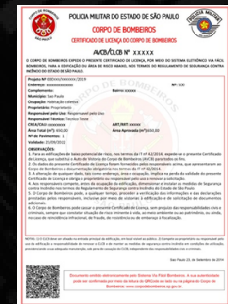
AVCB/CLCB (Corpo de Bombeiros)