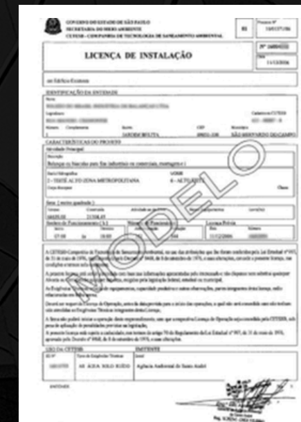
LICENÇA DE INSTALAÇÃO