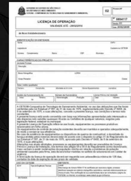
LICENÇA DE OPERAÇÃO