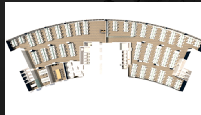
PLANTA DE IMPLANTAÇÃO