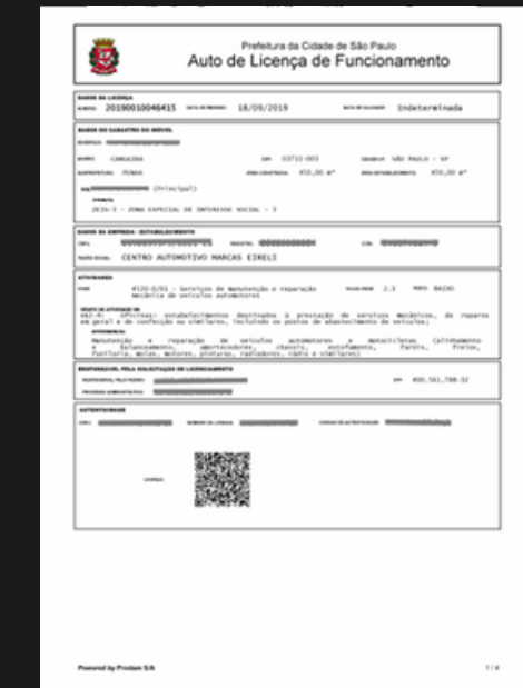
ALVARÁ DE FUNCIONAMENTO