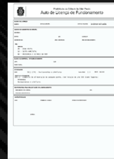
AUTO DE LICENÇA DE FUNCIONAMENTO